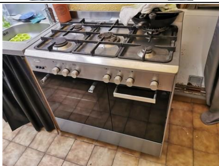
Photo n° PhGaz002 Localisation : Cuisine Cuisinière AIRLUX (Type : Non raccordé)