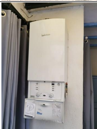
Photo n° PhGaz001 Localisation : Cuisine Chaudière e.l.m. leblanc (Type : Etanche)